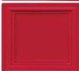
431 rdeča mat