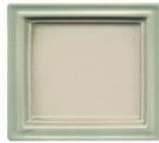
934 efekt zeleni rob mat