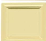
313 vanilija polmat