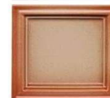
9312 efekt krem polmat + cotto