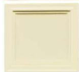
301 beige polmat