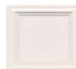
625 starinsko bela polmat