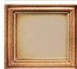
931 efekt rjavi rob lesk