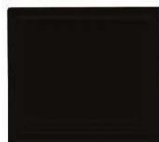
831 črna polmat