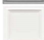
620 porcelanasto bela lesk