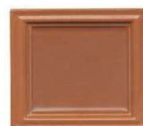
411 cotto temnejši