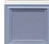
721 svetlomodra mat