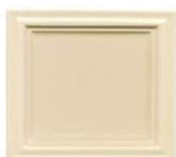
312 beige mat