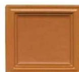
920 rjava temno