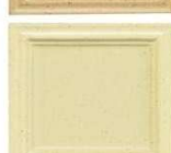
321 vanilija s pikicami polmat