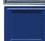
728 modra polmat