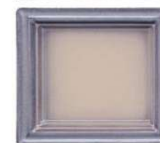
9310 efekt temnomodri rob polmat