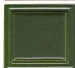
200 olivno zelena mat