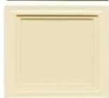
300 beige lesk