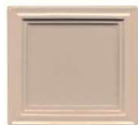
302 karamel lesk