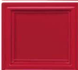
432 selen rdeča svetlejša