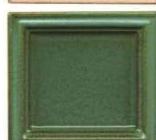
220 antik zelena polmat