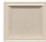
305 beige polmat s pikicami