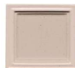
303 karamel mat