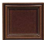
100 rjava lesk