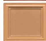
414 cotto oker svetlejši