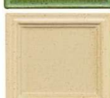
320 sand peščena