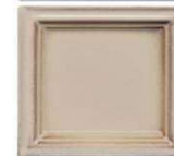
938 efekt antično bela sivi rob