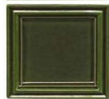
201 olivno zelena lesk