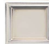
939 efekt antičnobela mat sivi rob