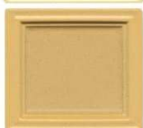
314 medeno rumena polmat