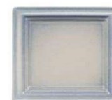
936 efekt svetlomodri rob beige polmat