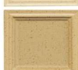
320E efekt sand-peščena temnejša