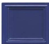
731 kobalt-modra mat