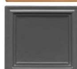
520 temno siva polmat