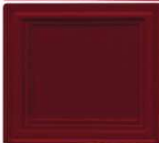
433 višnjerdeča lesk