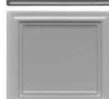
523 svetlo siva polmat