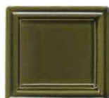
203 rjavo zelena lesk