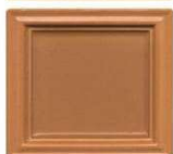
410 cotto svetlejši