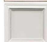
628 antično bela mat