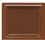
111 klinker rjava