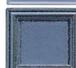
725 rustikalno modrorjava mat