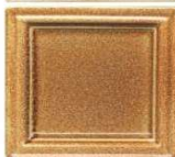
131 temnorjavi brizg neenakomeren