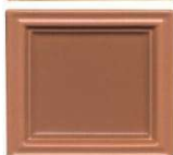
311 krem mat temnejša