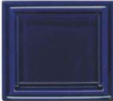
730 kobalt modra lesk