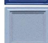
729 nebesno modra polmat