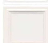
621 snežnobela polmat