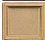
121 peščeno-rjava polmat