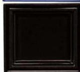
830 črna lesk