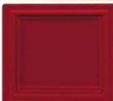
430 selen rdeča