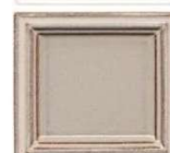
627 antično bela lesk