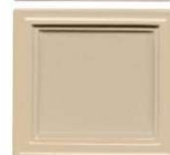
304 krem polmat