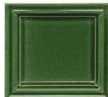
202 travnato zelena lesk