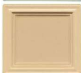
310 lešnik polmat