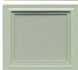
212 svetlozelena polmat