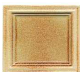
130 svetlorjavi brizg neenakomeren