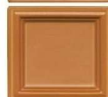
922 rjava svetlo